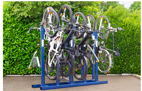
RANKO OnStreet