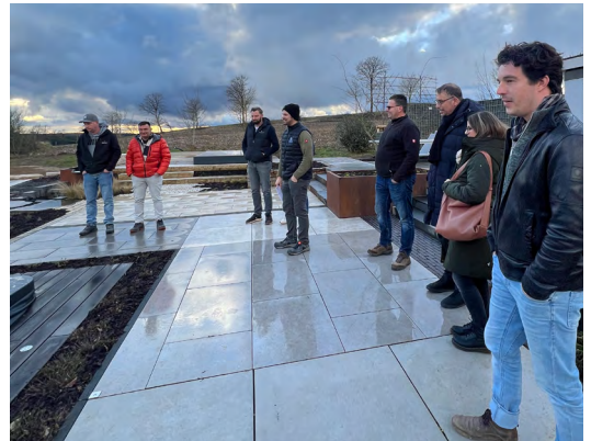
Regionalgruppentreffen Nord

Wir möchten uns herzlich bei allen Teilnehmern und Referenten bedanken und freuen uns bereits auf die kommenden Veranstaltungen im Jahr 2025. Gemeinsam können wir viel bewegen und unsere Branche voranbringen.