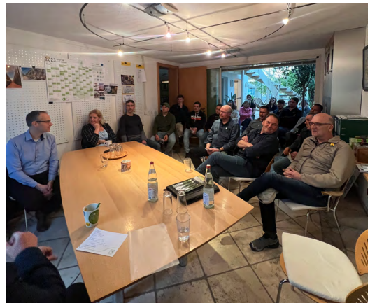
Regionalgruppentreffen Pfalz