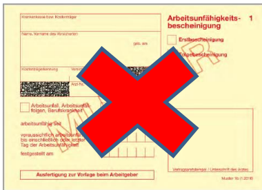
Muster 1 alt

Auch nach der neuen Rechtslage bleibt es dabei, dass der Arbeitgeber die Möglichkeit hat, ein früheres Tätigwerden des Arbeitnehmers zu verlangen. Nach der neuen Gesetzessystematik kann der Arbeitgeber nach Start des obligatorischen elektronischen Verfahrens am 1. Januar 2023 nicht mehr die Vorlage der Arbeitsunfähigkeitsbescheinigung verlangen, aber er kann verlangen, dass der Beschäftigte das Bestehen einer Arbeitsunfähigkeit und deren voraussichtliche Dauer schon früher als im Gesetz vorgesehen ärztlich feststellen lassen kann (§ 5 Abs. 1a Satz 2 iVm. Abs. 1 Satz 3 EntgG).